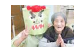
節分の鬼といっしょに