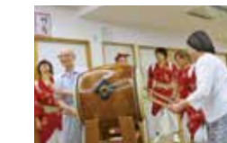
小倉名物祇園太鼓