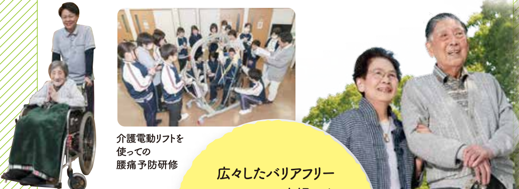
介護電動リフトを 使った 腰痛予防研修