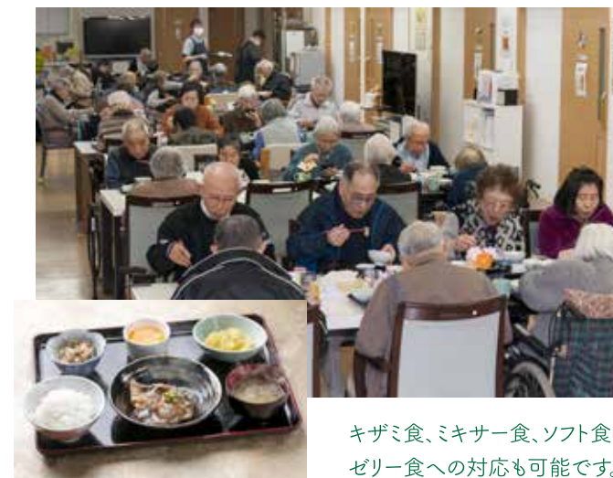
キザミ食、ミキサー食、ソフト食、ゼリー食への対応も可能です。

旬の食材を使った家庭料理を出来る限り提供したい、そんな思いから毎日の献立は調理スタッフ全員でつくります。四季折々の行事食を取り入れるなど、季節感あふれるメニューをご用意します。また、「できたての料理」を心掛けており、調理はみなさんの顔を見てから始めます。アツアツの美味しい食事をお楽しみ下さい。