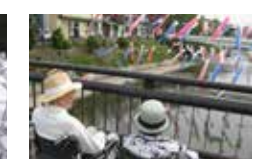
板櫃川で鯉のぼり鑑賞