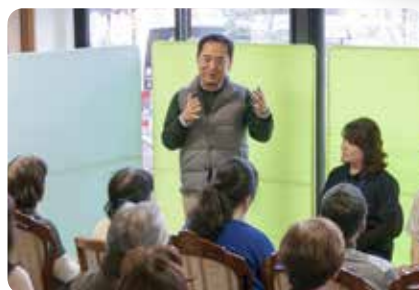
ご家族との運営懇談会