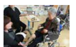
フットアロマセラピー