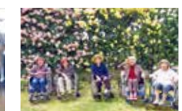
農事センターへ外出