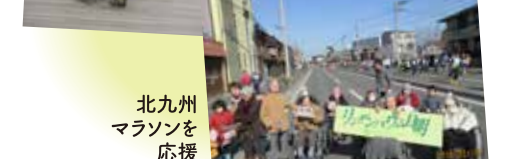
北九州 マラソンを 応援