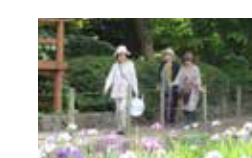
夜宮公園のあやめ鑑賞