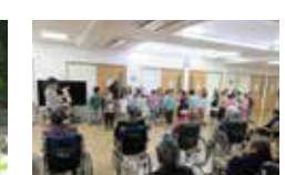
保育園児とのふれあい交流会