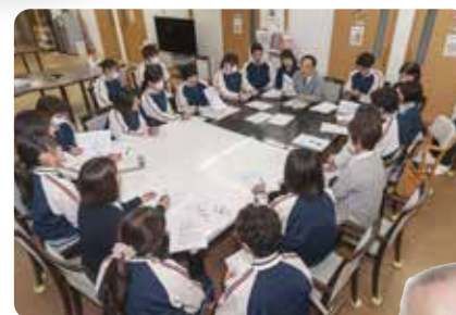
職員の定例全体会議