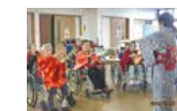
日本舞踊のレクリエーション