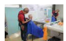
散髪で身だしなみ