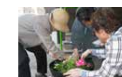
季節の花植えレクリエーション