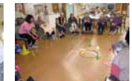
さまざまなゲームを行います